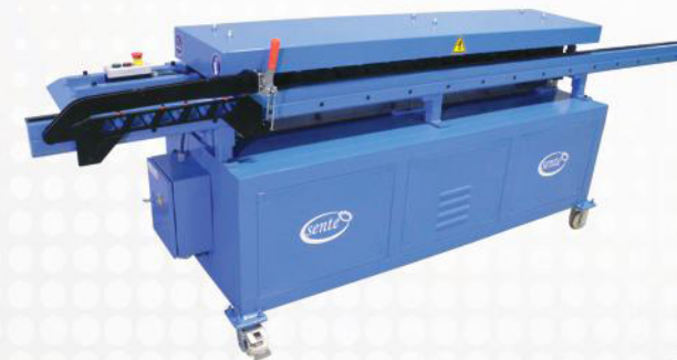
-TDF/TDC FLANŞ VE KLİPS MAKİNASI