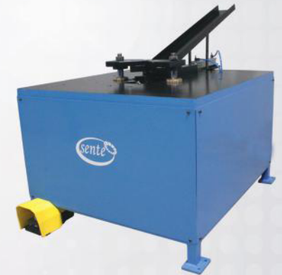
-KÖŞE ÇAKMA MAKİNASI