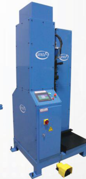
-DİK KAPATMA MAKİNASI